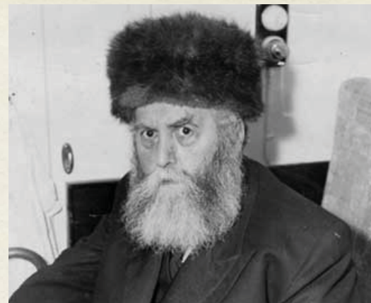
הרבי הריי"צ בעת ביקורו בארה"ק תרפ"ט

ימי שלוותה של הישיבה בחברון לא אורכים, אולם בתקופה קצרה מצליחה הישיבה להטביע את רישומה העמוק על פני העיר חברון וחוצה לה; פנים חדשות של בחורים וצעירים שהיו מלאים בתורה ובחסידות נראים בין סמטאותיה הצרים ומפחים חיים חדשים בעיר האבות. רבים מגיעים מכל קצוות הארץ לחזות בפלא של הישיבה החסידית הראשונה ולהתבסס מהאווירה המיוחדת, הם חשים כי הנה סופגים הם בקרבם את רוח ליובאוויטש המקורית כפי שהיא נושבת אי שם ברוסיה הרחוקה תחת השראתו של הרבי. שמע הצלחת הישיבה