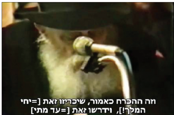
זוהי ההכרח כאמור, שיכריזו זאת [=יחי המלך!], וידרשו זאת [=עדת מתי]

זוהי ההכרח כאמור, שיכריזו זאת [=יחי המלך!] וידרשו זאת [=עדת מתי] כמדובר כמה פעמים; ובפרט בימי חודש ניסן, שמכונה מצד שהוא חודש הגאולה. בניסן עתידין להגאל