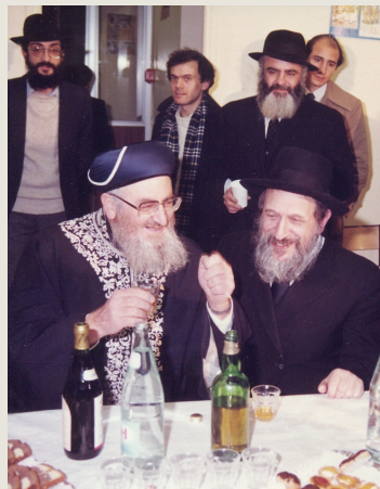
עם הראשון לציון הגאון הרב המקובל מרדכי אליהו

רבי הלל, שיראק עוזר למוסדות? "הרבה. פעם בהסתר ופעם בגלוי" הוא אוהב ישראל או לא? "באופן פרקטי - כן" למה בעניין הישראלי הוא נוטה תמיד לצד שכנגד? "יש לו הרבה אינטרסים זרים בעניין זה"