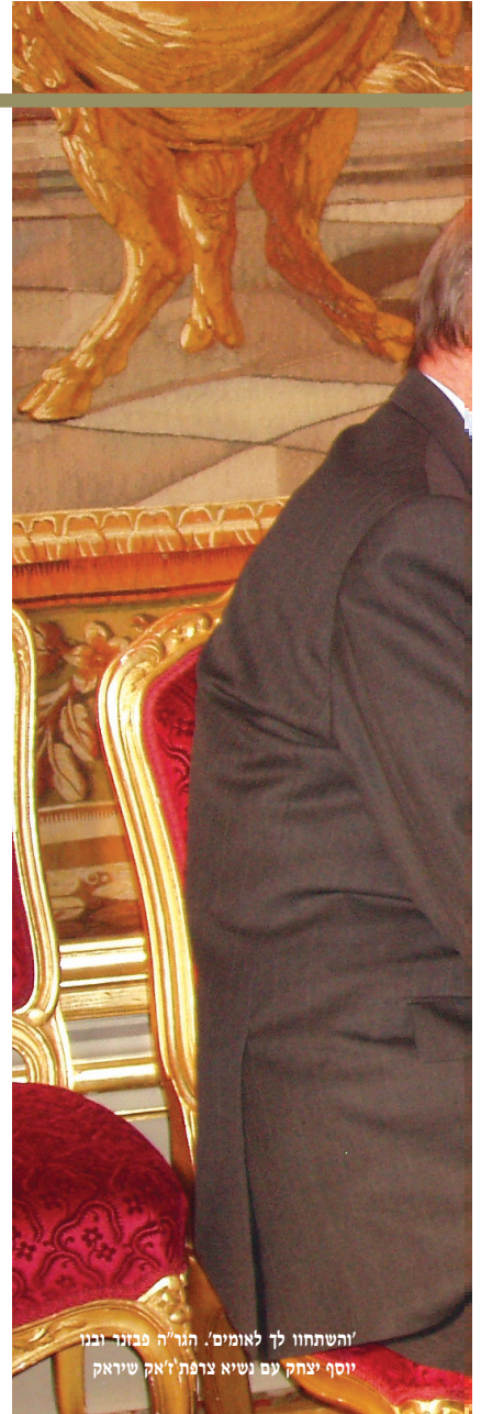
"והשתחו לך לאומים". הגר"ה פבזנר ובני יוסף יצחק עם נשיא צרפת ז'אק שיראק

◆ במצב כזה איך הצלחתם לנהל בית חסידי כל כך?