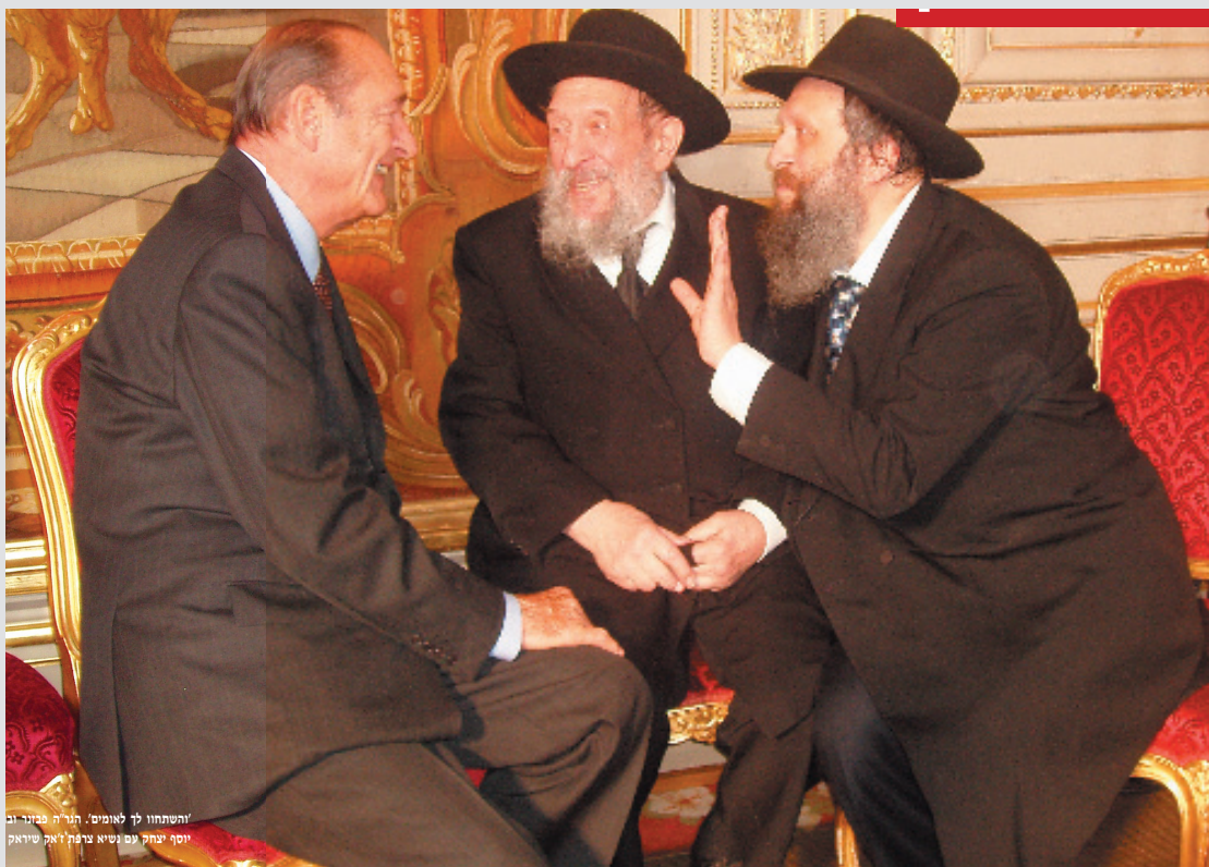
‘והשתחוּ לך לאומים’ הוֹיָה פְּגוּרֵי וּבִי יוֹסֵף יִצְחָק עִם נְשִׂיא בְרִית זְאֵק שִׂידָאָק

lui dit son fils sur un ton convainquant, et seulement après ces paroles d’encouragement, le Rav accepte de répondre à nos questions, convaincu qu’ainsi il va œuvrer pour le bien du Judaïsme. Rien ne peut l’empêcher d’agir quand il s’agit d’œuvrer dans ce sens, pour le bien du judaïsme.