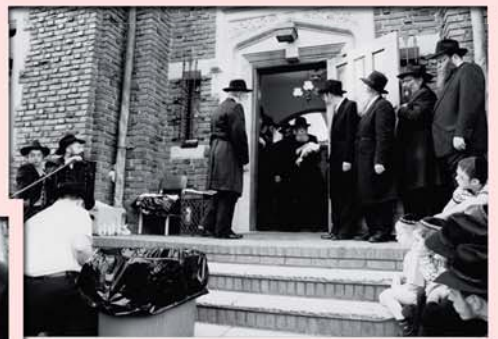
יוצא מ-770 ובידו תרגול הכפרות, בדרכו לשוחט