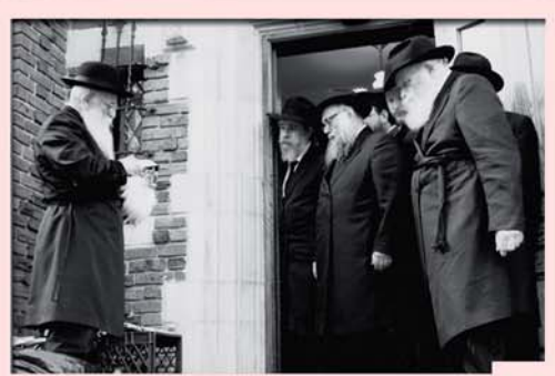
בזמן שחיטת תרגול הכפרות