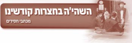
השה"ה בחצרות קודשיו מכתבי חסידים