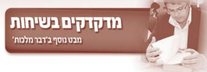
מדקדקים בשיחות מבט נוסף בדבר מלכות