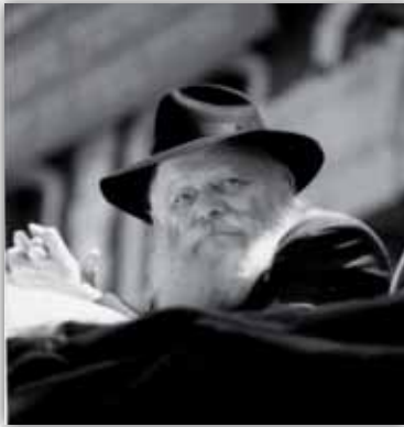
כ"ק אד"ש בפאראד בשנת תשמ"ז