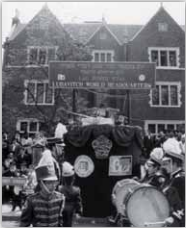
כ"ק אד"ש בפאראד בשנת תשמ"ד

אבל לא רק מפני כך, יש עוד הרבה סיבות טובות, כדי שהאירוע האדיר הזה ייהפך ליותר מ"משהו סתם". פניו הקדושות של הרבי, למשל, לא נראות כך בכל פעם, רק מי שהיה, רק מי שהשתתף, יכול לספר על אותם חיוכים מיוחדים שמחייך הרבי לאלפי הילדים. רק מי שראה יכול לתאר את המחווה הנפלאה הזו: הרבי עומד במשך למעלה משעתיים ומנופף לשלום לאלפי הילדים הצועדים בסך. אבל מי שהיה, יכול רק לספר, לתאר – ואת המחזות הללו צריך לראות.