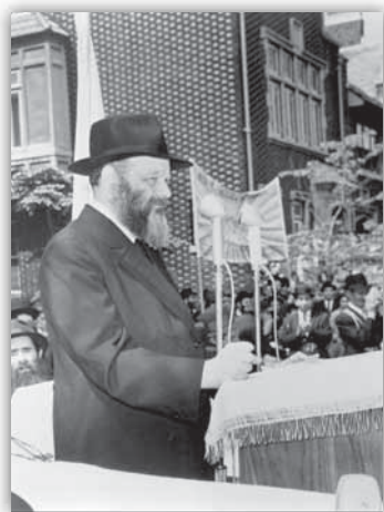
כ"ק אד"ש בפאראד בשנת תש"כ

בין המדריכים של אותן שנים, במסיבות שבת, אפשר למצוא ברשימות הקיימות את הרבנים חברי