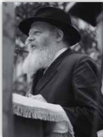
כ"ק אד"ש בפאראד בשנת תש"ל

שלוש שנים אחר כך בשנת תשל"ל התקיים שוב "פאראד" ענק, שהפך עד מהרה למיפגן של קידוש ה'.