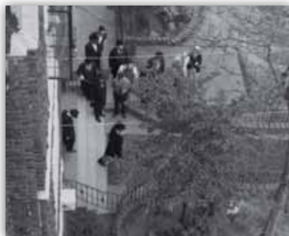
כ"ק אד"ש מה"מ יוצא לפאראד בא' השנים