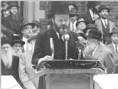
כ"ק אד"ש בפאראד בשנת תשי"ז

כל קבוצת ילדים נשאה שלט הודעה בקשר לשמירת שבת וחינוך יהודי, כמו: "תשמור את השבת היא תשמור עליך", "שלח את ילדיך