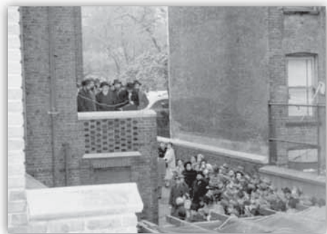
הפארד בשנת תשי"ג. כ"ק אד"ש עומד על המרפסת

מספר כי: "הרבה בחורי ישיבות שהיו תחת השפעת הרבי היו משתתפים בפעולות של האירגון, אבל הרבה רבנים ומוסדות חינוך לעגו לכל הפעילות – הם אמרו שהרבי אינו יודע מה הוא עושה. שנים אחר כך, כשהם ראו את ההצלחה הגדולה של שיטת הרבי והפעולות שעשה, הם החלו לחקות אותו ואת פעולותיו".