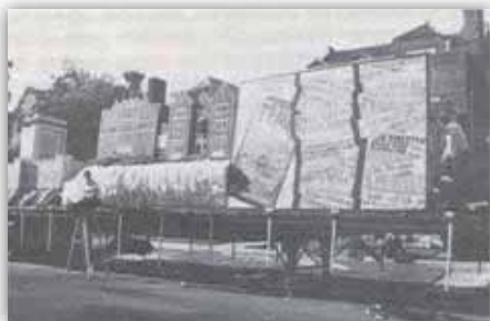
מימין: פתגם אדמו"ר הזקן – כשמשיח יבוא יהיה כתוב בעיתונים... משמאל: ביהמ"ד החדש 770 על ענני שמיא

ויורדת. אקט זה מסמל את דברי כ"ק אדי"ש מה"מ ש"פעולת הגאולה היא להכניס את האות אליך ב"גולה" ונעשה "גאולה". כן הדגימו לקהל הרחב את מציאות אחרית הימים כאשר "כל המעדנים מצויים כעפר", בהמחישם שדה עם עצים ועליהם תלויים וגודלים מאכלים, כסף וכו' לרוב, כולל גם עצי סרק, כנאמר שאף הם עתידים לשאת פירות.