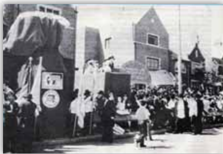
בציפי' עמוקה להשתתפותו של כ"ק אד"ש מה"מ

במיוחד תצויין יצירתם של תלמידי ה'קבוצה' – חובבי תורה, שעשו כתר גדול ויפה, עליו כתוב יחי אדוננו... וכן כדור העולם כשתחתיו כתובות האותיות גאולה, ובאמצע – האות "אל"ף" עולה