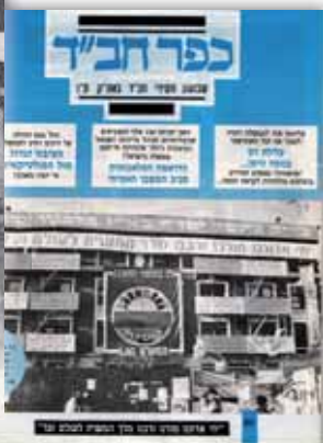
'כפר חב"ד' מסקר את הפאראגאז: יחי אדוננו – סיממת המלכות והגאולה