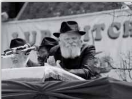
כ"ק אד"ש בפאראד בשנת תשמ"ג