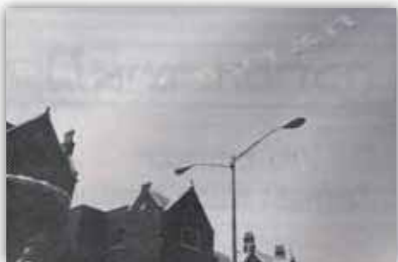
מטוסי סילון יצרו את הכתובת: "הצדעה למשיח"

התהלכה נמשכה כשעה וחצי, ובסיומה המשיך הקהל ל'פארק' שמעבר לשכונה. הקהל, למותר לציין, עזב את הכינוס בתחושת אכזבה, שכן כינוס כ"כ יפה ומוצלח, בהשקעה של שבועות ארוכים של עבודה והרבה כסף – יכל להיגמר הרבה יותר משובח וגדול לו זכינו להשתתפותו של כ"ק אד"ש מה"מ, ולו לדקה בלבד! ובודאי, כפי שציינו רבים, באם הי' רואה את הכינוס, הי' זה מיסב לו קורת רוח רבה. אך ל'ירידי' הזה, מסתבר, לא זכינו.