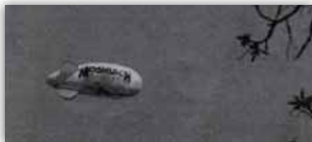
בלון גדול דמוי מטוס ריחף מעל, ועליו הכתובת: "משיח, הבה נהיה מוכנים"

שלב ב' – ללמוד עניני משיח וגאולה, וכאן מציגים את כל הספרים והחוברות שיצאו בעניני משיח. שלב ג' – דברי כ"ק אד"ש מה"מ בנוגע ל"וכתתו חרבותם לאתים" – תקופת ימות המשיח, ומראים לנו את החרבות שהפכו לאתים, וצריכים רק "לפתוח את העיניים"... ושלב ד' – הגאולה האמיתית והשלימה! וכאן מראים את השער לה' המוביל לבית המקדש השלישי, כשצריכים לעבור דרך "בית רבנו שבבבל" ע"מ להכנס לבית המקדש.