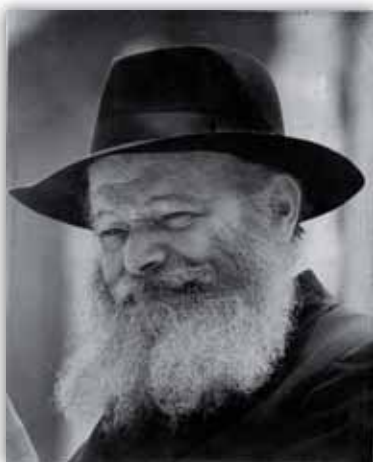
כ"ק אד"ש בפאראד בשנת תשל"ו

בשנת תשל"ו התקיים ה"פאראד" הגדול ביותר כפי שהוא זכור למשתתפים מאותן שנים. גדול, אבל גם חריג ביותר.