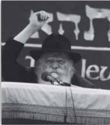
כ"ק אד"ש בפאראד בשנת תש"נ