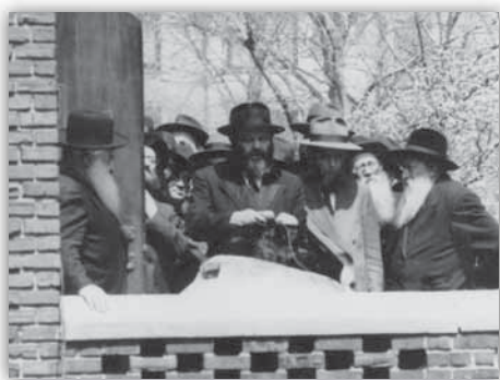
כ"ק אד"ש מה"מ מדבר בפאראד בשנת תשי"ג

באותן שנים, יש לזכור, היתה הקהילה החב"דית קטנה. הרב העכט