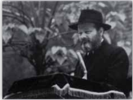
כ"ק אד"ש בפאראד בשנת תשט"ז

העכט, היה המתרגם של שיחות הרבי באותו כינוס. הרב ז.כ. היה אחד הילדים שהשתתפו בכינוס: "אני השתתפתי בכינוס ל"ג בעומר של תשי"ג. זו הייתה, אני חושב, הפעם הראשונה שהרבי יצא לדבר שיחה לילדים. כל הילדים ישבו למטה בחצר והרבי שליטי"א עמד למעלה על המרפסת ודיבר".