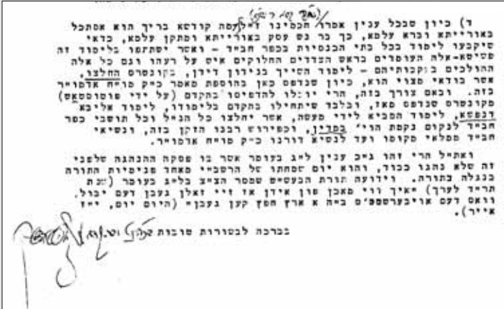
(האגרת נדפסה באג"ק כ"ק אד"ש חכ"ה ע' קמ-קמא)

לפינו צילום חלק מאגרת כ"ק אד"ש מתאריך ט"ו אייר תשכ"ח עם הוספות בכתי"ק בפרסום ראשון. בה כותב אודות לימוד קונטרס "החלצו" ע"מ להוסיף באחדות ישראל, ומקשר לענין ל"ג בעומר. בו פסקה ההנהגה ש"לא נהגו כבוד"