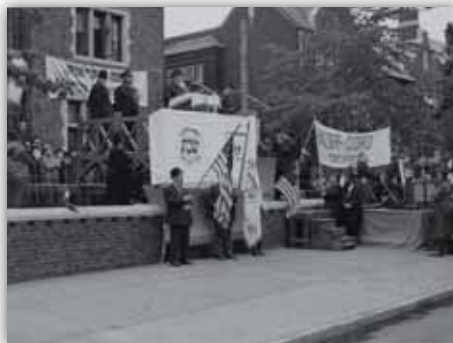
כ"ק אד"ש בפאראד בשנת תש"ל