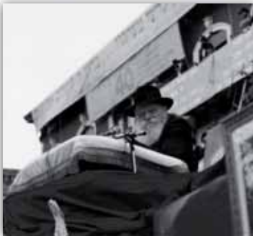
כ"ק אד"ש בפאראד בשנת תש"נ

הזדמנויות נוספות לעשות יחד באהבת ישראל ואחדות ישראל".